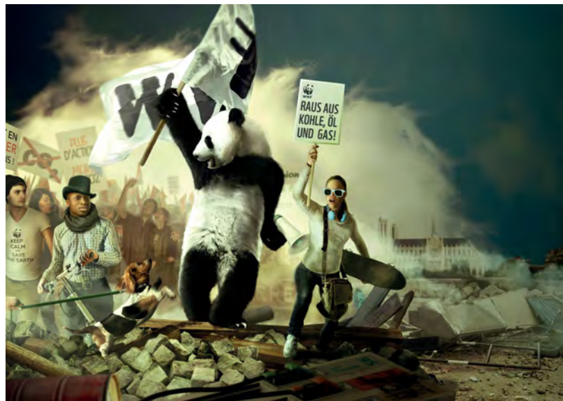
Weitere Informationen u. a. zum Klimagipfel auf wwf.de/paris

Umweltministerin Barbara Hendricks hat erklärt, dass Deutschland Vorreiter sein will und nach der Konferenz einen konkreten Plan zum Ausstieg vor allem aus der Kohle vorlegt. (MiWi).