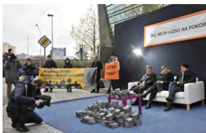
Demonstration in Prag (Foto: Greenpeace)

78 Prozent der Deutschen wollen den Ausstieg aus der Kohle als Energieträger, ergab eine aktuelle Studie des Emnid Instituts. Bei den CDU/CSU-Anhängern sind es 74 Prozent, bei denen der SPD 89 Prozent.